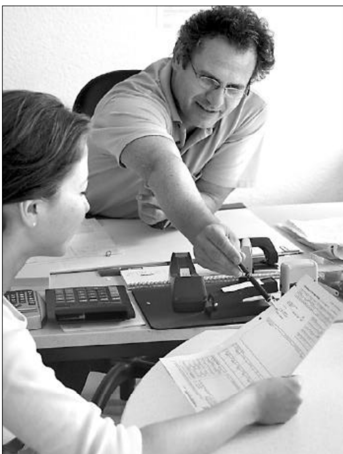
Verhandlung mit dem Chef: Per Gehalt vorsorgen