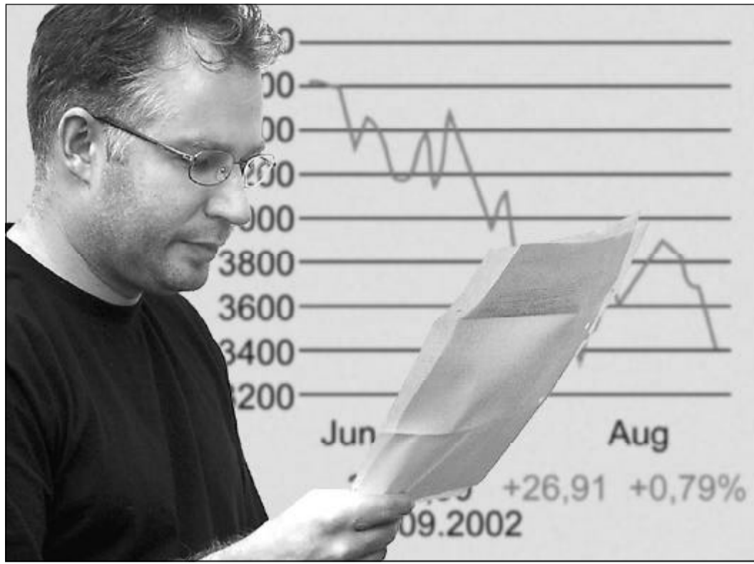
DAX-Zertifikat: Gewinnen und verlieren im Gleichschritt der Börse