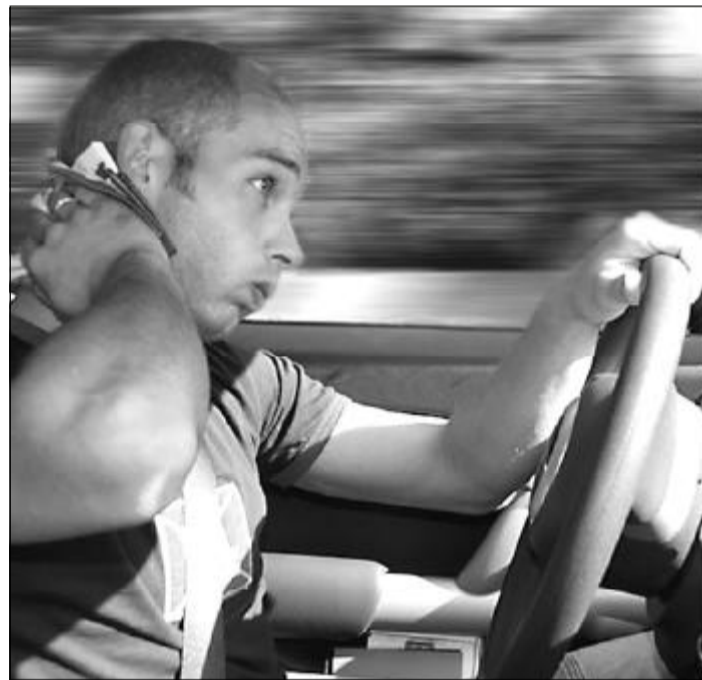
Klimaanlage: Autobauer verweigern Service