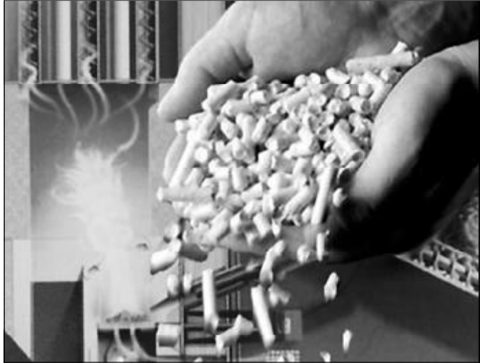
Holzpellets: Weitmaschiges Händlernetz

Beratung über die Holzpelletheizung gibt es bei der Verbraucher-Zentrale NRW. Dort gilt die Devise: Pellets lassen sich sowohl im simplen Pelletofen wie in einer zentralen Pelletheizung energieeffizient und umweltschonend verfeuern. Selbst mit einer Solaranlage kann die Pelletfeuerung kombiniert werden.