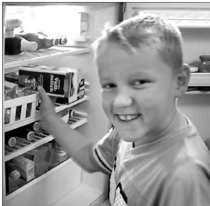
Kühlschrank: Stromkosten im Blick

Die CO 2 -Klimaanlage funktioniert ähnlich wie die herkömmliche R134a-Klimatisierung, also auch mit Klimakreislauf, Verdampfer und Trockner. Lediglich der Druck ist um ein Vielfaches höher: 130 bar statt 20 bar. Vorteil der CO 2 -Klimaanlage: bis zu 20 Prozent weniger Spritverbrauch, höhere Kühl-Leistung, schnelleres Ansprechen. Doch vor 2005 soll sie nicht auf den Markt kommen. Toyota will der erste Hersteller sein, der eine CO 2 -Klimatisierung anbietet. Voraussichtlich in einem Elektroauto.