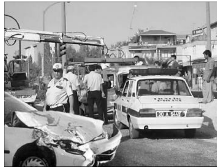
Zusammenstoß: EU beschleunigt Regulierung

Ein Manko allerdings: Noch ist das Händlernetz für die