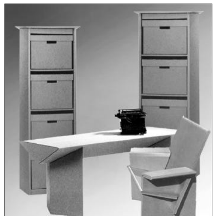
Pappmöbel: Beim Brockhaus etwas geknickt

Dafür gibt es anschließend keinerlei Probleme mit der Entsorgung. Die einzelnen Faltelemente von Bett und Tisch aus Pappmaschee, von Stuhl und Wäscheschrank passen mühelos in jeden Müllcontainer.